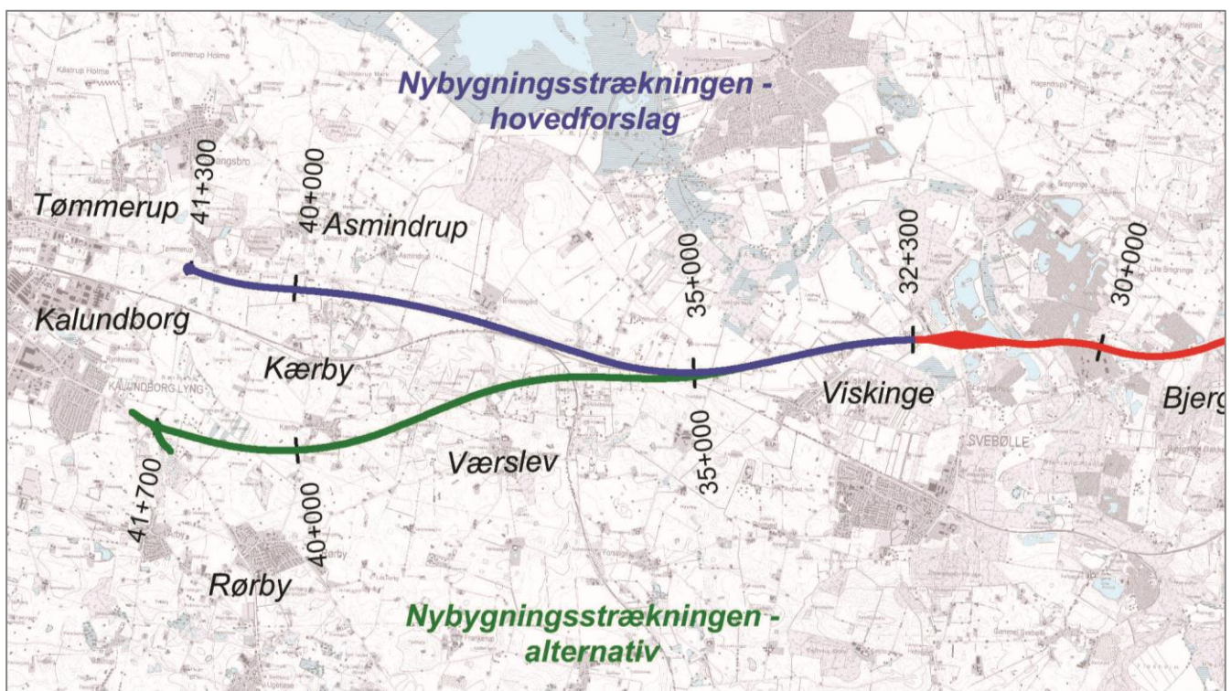
Figur 2: Hovedforslag og alternativ for en ny motorvej mellem Viskinge og Kalundborg.

Hovedforslaget bygger videre på tanker og synspunkter, der blev fremført ved den forudgående offentlige debat ved indledningen af VVM-undersøgelserne, og på samarbejdet med Holbæk og Kalundborg Kommuner og en følgegruppe bestående af lokale borgere.